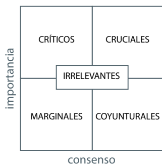
Figura 3. Distribución de resultados Adaptado de Ruiz Olabuénaga (2003)

Para tener una idea detallada del consenso se va a realizar un análisis de los 145 ítems siguiendo el siguiente esquema: 1) nivel de consenso y homogeneidad general; 2) nivel de consenso por grupos de expertos; y 3) clasificación